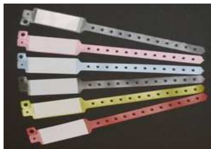
BRACELETS EN VINYLE